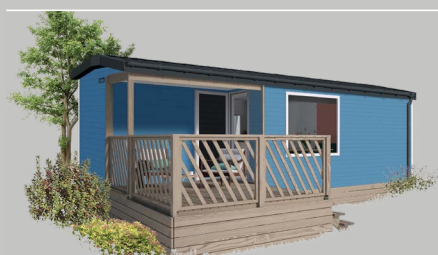
Loggia 2 mit 4-seitiger Fassadenverkleidung in Azur.

Haupteigenschaft dieses Mobilhomes ist das große Panoramafenster über dem Ecksofa, durch das man einen fantastischen Blick auf die Landschaft genießt. Genau das, was Urlauber wollen!